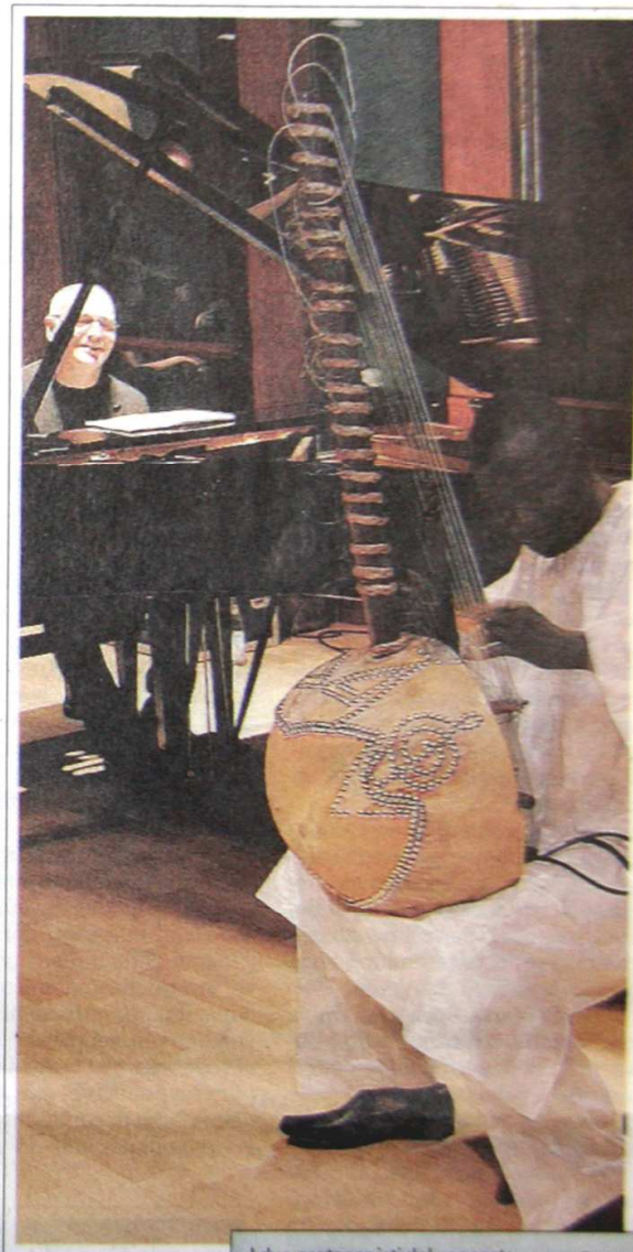
I due protagonisti del concerto